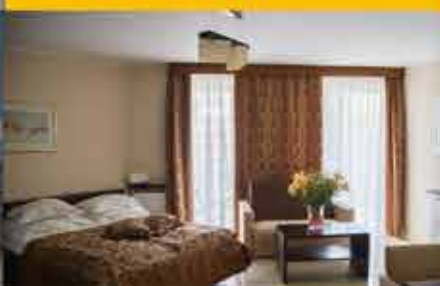
Zimmerbeispiel, 3★ Hotel Avangard Resort