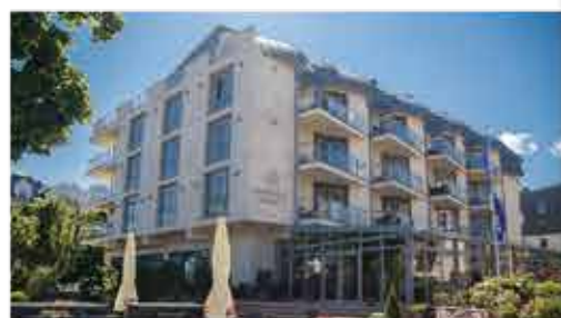
3★ Hotel Avangard Resort